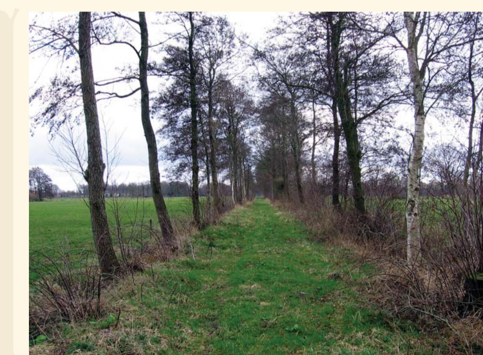
Oude ree (landweg) ter hoogte van het petgat.

Petgaten zijn ontstaan door het afgraven van laagveen voor de winning van turf als brandstof. Rond 1900 waren in de laagveengebieden in het Westerkwartier uitgestrekte moerasgebieden met honderden rechthoekige petgaten. Tussen de petgaten lag een legakker: een smalle strook land waarop de uitgeschepte turf te drogen werd gelegd. In een periode van droogte gebruikten boeren het water uit dit petgat als drinkwater voor hun vee.